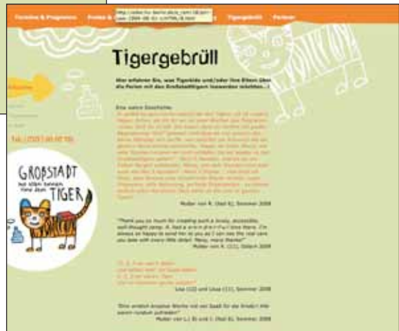
Websites der www.grossstadttiger.de