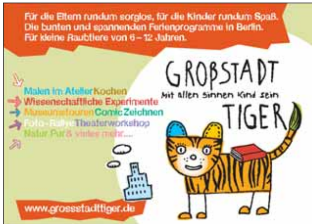
Flyer der „GroßstadtTiger“ in englischer Sprache